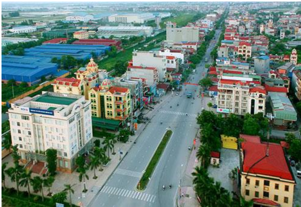
Thị xã Từ Sơn ngày càng đổi mới.