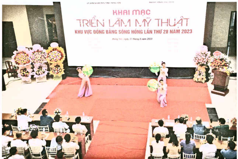
Không gian khai mạc triển lãm khu vực II năm 2023 tại Bảo tàng tỉnh Hưng Yên.

Ngay từ đầu mới thành lập, với tôn chỉ nhằm thúc đẩy sự sáng tạo và vinh danh các họa sỹ và nhà điêu khắc chuyên nghiệp là hội viên Hội Mỹ thuật Việt Nam đang sinh sống và làm việc tại các tỉnh, thành phố. Triển lãm