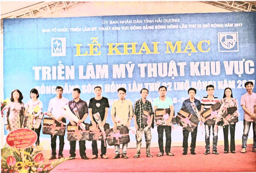
Các tác giả trẻ nhận hoa chúc mừng từ Hội đồng Nghệ thuật năm 2017

truy cập, thường thức, tương tác, đánh giá tác phẩm.