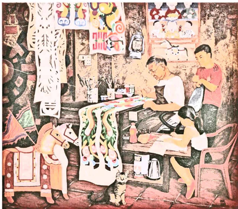
Tác phẩm: Góc nhỏ của ông, sơn dầu, Giải B TLKV II năm 2020, Tác giả Lê Minh Đức (Quảng Ninh)