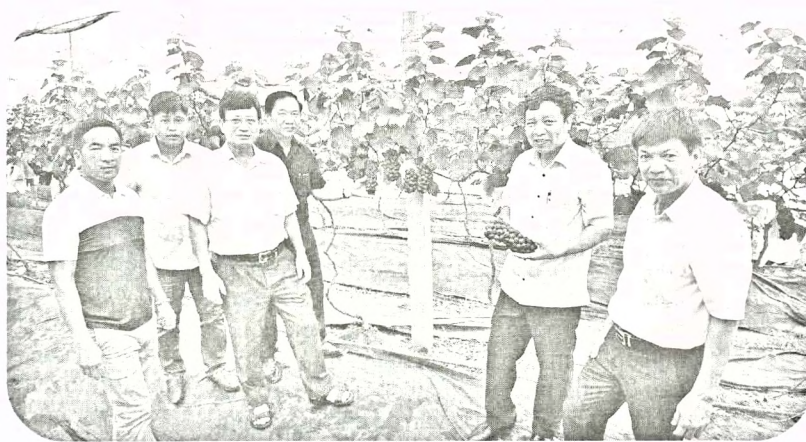
Cán bộ Hội NN - PTNT tỉnh Bắc Ninh thăm mô hình trồng nhọ xạ đen ở xã Bình Dương, huyện Gia Bình.

Qua đó, vừa góp phần thay đổi tập quán sản xuất của người dân, mang lại hiệu quả kinh tế cao; vừa tạo động lực, đẩy mạnh quá trình xây dựng nông thôn mới và thúc đẩy phát triển sản xuất nông nghiệp trên địa bàn tỉnh. ❖