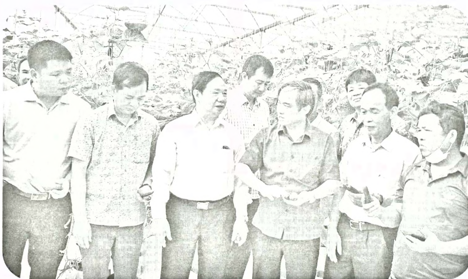
Cán bộ Hội NN - PTNT tỉnh Bắc Ninh thăm mô hình trồng dưa baby trong nhà lưới ở xã Lăng Ngâm, huyện Gia Bình.