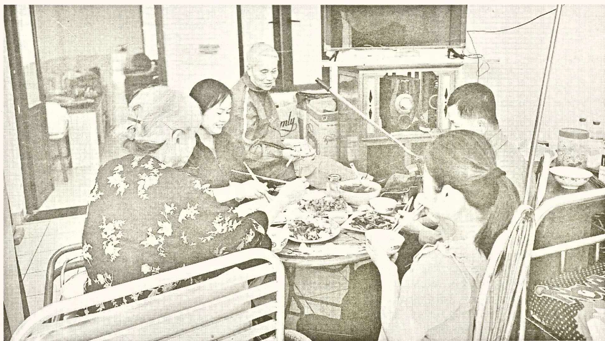
Các thương - bệnh binh coi nhau như anh em, người thân trong gia đình, cùng nhau chia ngọt sẻ bùi.

Dù chiến tranh đã lùi xa hàng thập kỷ, nhưng những di chứng nặng nề vẫn âm ỉ trong cơ thể các thương, bệnh binh. Dẫu phải đối diện với những nỗi đau về thể chất, họ vẫn kiên cường vượt lên, nỗ lực không ngừng để chứng minh rằng: họ không phải là những người "tàn phế", mà là những con người sống với ý chí sắt đá, không bao giờ chịu khuất phục trước bất kỳ thử thách nào.