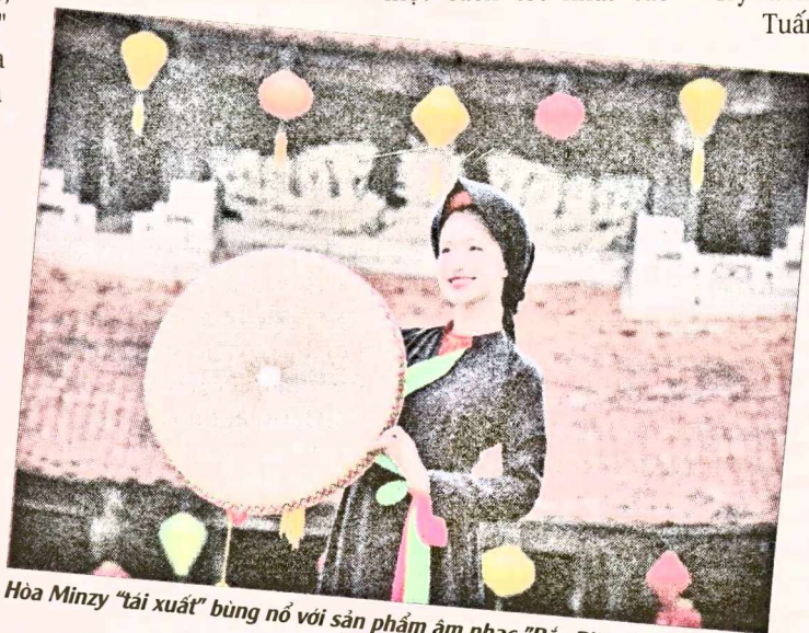
Hòa Minzy "tái xuất" bùng nổ với sản phẩm âm nhạc "Bắc Blink".

Ca sĩ Hòa Minzy chia sẻ thêm, cái tên "Bắc Blink" mang ý nghĩa đặc biệt, thể hiện mong muốn của cô mang hình ảnh Bắc Ninh tươi đẹp, lấp lánh và tỏa sáng vào âm nhạc. Cô cũng đã nhận được sự chấp thuận của lãnh đạo tỉnh Bắc Ninh về từ "Blink" với hàm ý tích cực và hiện đại, giúp thể hiện trọn vẹn tinh thần của bài hát. Dự án này không chỉ đơn thuần là một sản phẩm âm nhạc mà còn là cách để Hòa Minzy bày tỏ tình yêu quê hương, văn hóa và truyền thống dân tộc. Cô mong muốn mang tình làng nghĩa xóm, tình yêu cội nguồn vào trong từng khuôn hình, từng giai điệu, để mọi người thấy được vẻ đẹp Bắc Ninh không chỉ trong nghệ thuật mà còn trong văn hóa và con người nơi đây.