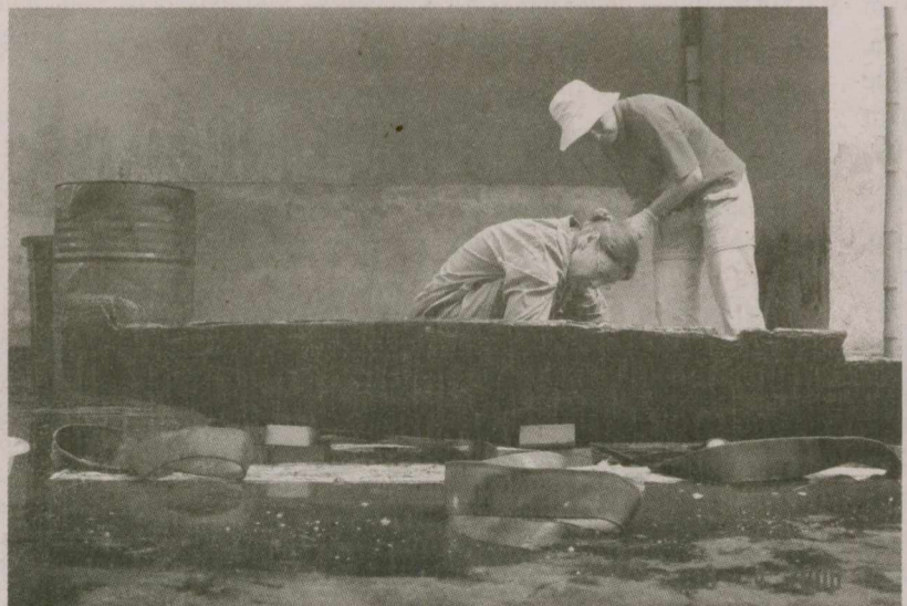
Chuyên gia Bảo tàng Quốc gia Australia đang bảo quản nửa chiếc thuyền được dùng làm quan tài ngôi mộ Đông Sơn 04ĐX-M01, khai quật ở Động Xá năm 2004