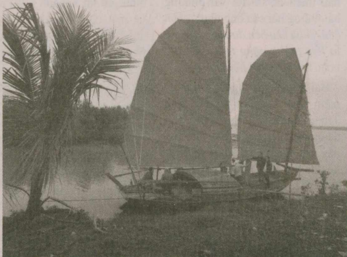
Thuyền buồm cánh dơi do tác giả đầu tư để dùng trong việc gìn giữ di sản thuyền cánh dơi và dùng để trực vớt thuyền độc mộc kèm gốm sứ ở vùng sông Lục Đầu - Kinh Thầy