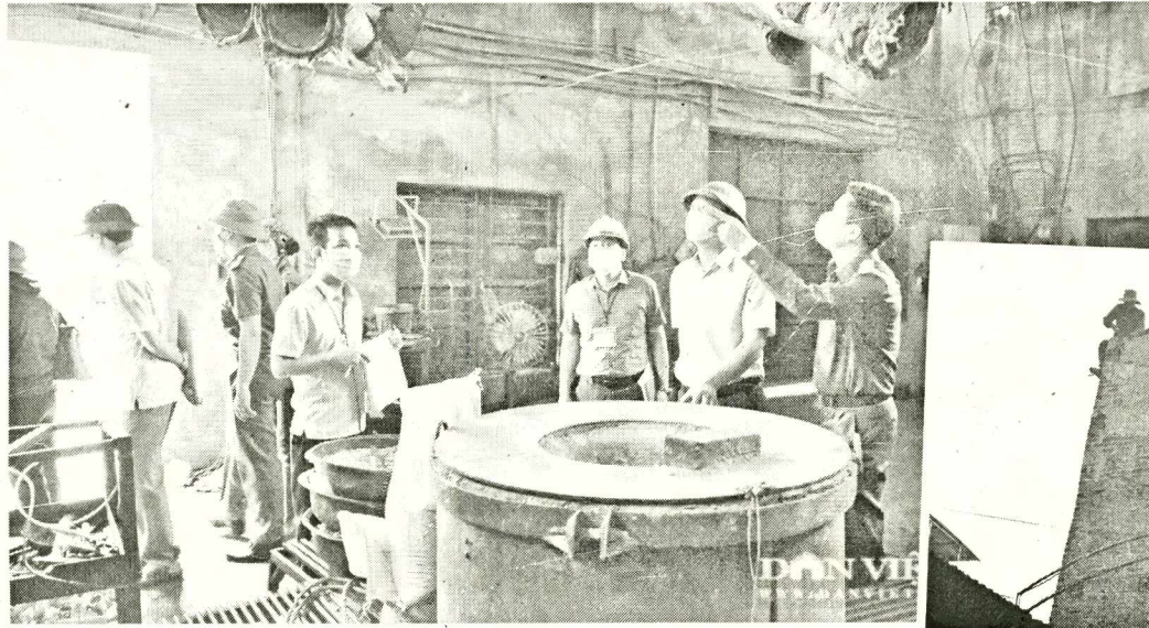
◉ Đoàn kiểm tra tại một cơ sở sản xuất tại huyện Gia Bình, Bắc Ninh. Khương Lục

◉ Công nhân đang tháo dỡ một ống khói tại huyện Gia Bình. Khương Lục