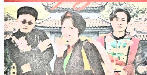
Đây là sản phẩm đánh dấu sự hợp tác giữa ca sĩ Hòa Minzy cùng với danh hài Xuân Hinh, nghệ sĩ Tuấn Cry.

MV Bắc Bling không chỉ gây ấn tượng bởi giai điệu cuốn hút, hình ảnh đẹp mắt mà còn bởi sự góp mặt của những nghệ sĩ gắn bó sâu sắc với quê hương Bắc Ninh. Trong Bắc Bling , chị khắc họa hình ảnh một cô gái Bắc Ninh điệu đà, cá tính, hòa mình vào không gian văn hóa đầy nghệ thuật. Bên cạnh đó, sự góp mặt của nghệ sĩ Xuân Hinh khiến nhiều người bất ngờ. Chú Xuân Hinh được mệnh danh là “Vua hài đất Bắc” và cũng là một nghệ sĩ gạo cội đến từ Bắc Ninh. Phần hát và rap cá tính, duyên dáng của chú Xuân Hinh đã tô