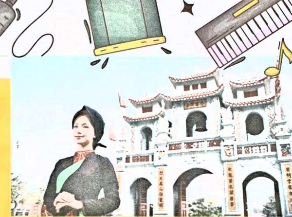
Đền Bà Chúa Kho là một trong những điểm đến tâm linh quan trọng, thu hút hàng nghìn du khách mỗi năm ghé thăm cầu tài lộc, bình an.