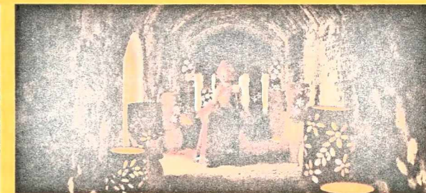
Làng gốm Phù Lãng nổi tiếng với dòng gốm men da lươn đặc trưng.