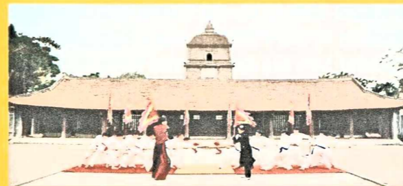
Chùa Dâu là địa danh gắn liền với sự phát triển của Phật giáo trên đất Bắc.

Không chỉ là một sản phẩm âm nhạc, Bắc Bling còn mang đến trải nghiệm như một thước phim quảng bá du lịch Bắc Ninh. Xuyên suốt hơn 4 phút, MV dẫn dắt khán giả qua hàng loạt địa danh nổi tiếng, tái hiện vẻ đẹp linh thiêng, đầy sức sống của vùng đất Kinh Bắc. Qua từng cảnh quay, Bắc Ninh hiện lên đầy màu sắc, vừa hoài cổ vừa hiện đại, xứng đáng là một điểm đến hấp dẫn trên bản đồ du lịch Việt Nam.