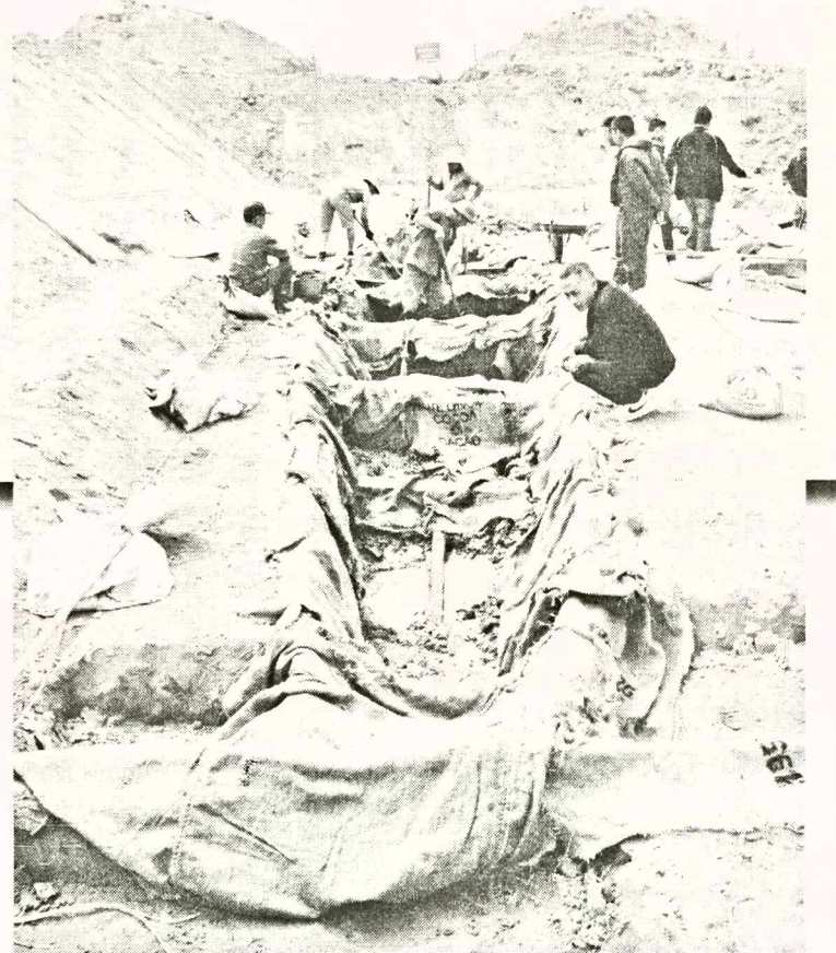
Một trong hai thuyền cổ vừa được phát hiện

Một điểm đáng chú ý, trong khoang hai thuyền cổ này được người xưa thiết kế chia thành 6 khoang, lòng thuyền đẽo giạt cấp. Điều đáng nói, kích thước thực của con thuyền có thể lớn hơn nhiều vì khả năng phân bên trên đã bị mất. Sở dĩ dự đoán như thế là bởi có hệ thống mộng chạy dọc mạn thuyền