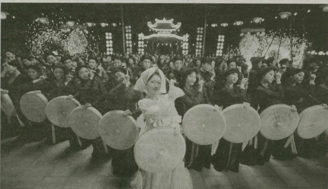
MV "Bắc Bling" đã góp phần lan tỏa văn hóa Kinh Bắc ra thế giới.

"Anh đưa em về sông Đuống/ Ngày xưa cát trắng phẳng lì/ Sông Đuống trôi đi/ Một dòng lấp loáng". (Thơ Hoàng Cầm)