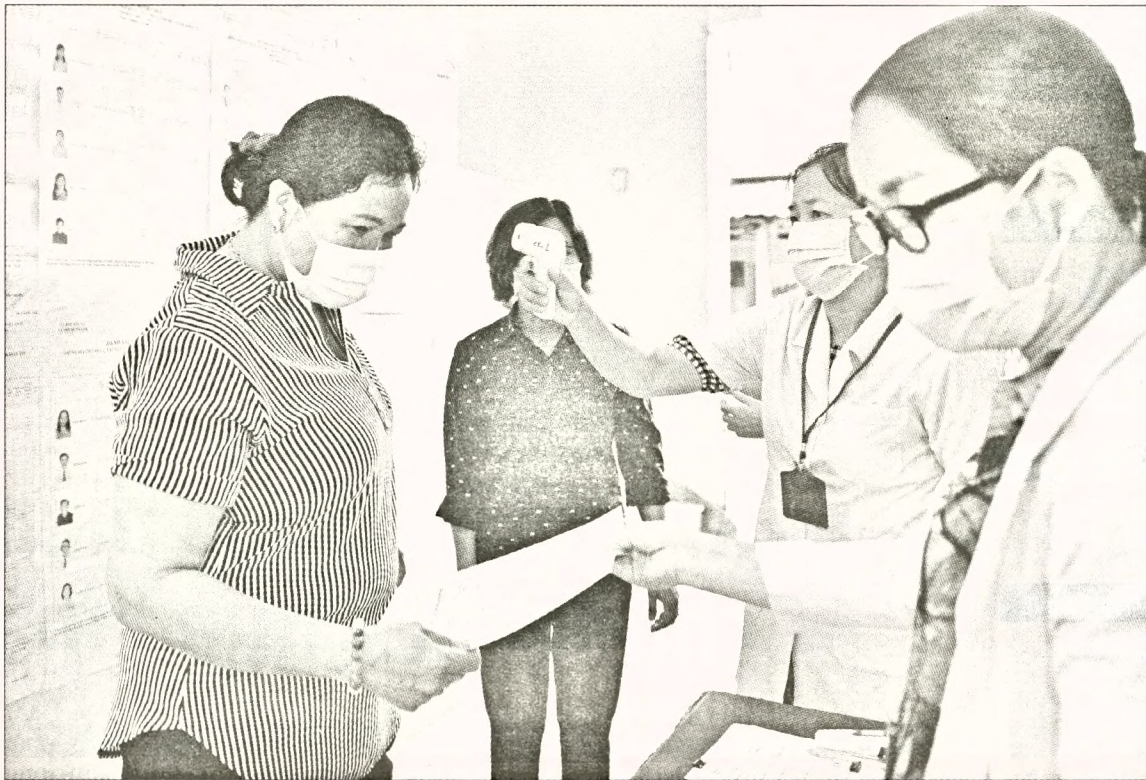
Cử tri xã Phước Thạnh, huyện Củ Chi, TP.HCM khai báo y tế trước khi tiếp xúc giữa cử tri với người ứng cử đại biểu Quốc hội, chiều 21-5

"Chúng tôi tổ chức 1 hòm phiếu cố định cho cán bộ, nhân viên bệnh viện và 2 hòm phiếu di động cho khu phòng điều trị" - đại diện Bệnh viện Bệnh nhiệt đới trung ương cho biết. Bệnh viện K