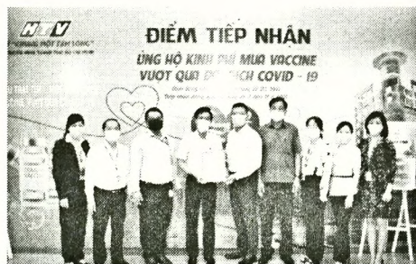
Các cá nhân, tổ chức ủng hộ kinh phí mua vắc xin chống Covid-19

Q ũy vắc xin phòng dịch Covid-19 được thành lập để tiếp nhận, quản lý và sử dụng các nguồn tài trợ, hỗ trợ, đóng tự nguyện bằng tiền, vắc xin của các tổ chức, cá nhân trong nước, ngoài nước và các nguồn vốn hợp pháp khác cho hoạt động mua, nhập khẩu vắc xin, nghiên cứu, sản xuất vắc xin trong nước và sử dụng vắc xin phòng dịch. Chính phủ đề nghị ban thường trực Ủy ban Trung ương Mặt trận Tổ quốc Việt Nam phát huy trách nhiệm trong công tác vận động nguồn lực của các tổ chức, cá nhân đóng góp cho quỹ. Đồng thời, cơ quan này cũng thực hiện giám sát để đảm bảo quản lý, sử dụng quỹ đúng mục đích, công khai, minh bạch và hiệu quả.