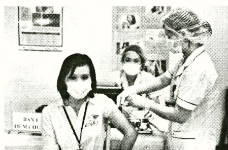
Công nhân các khu công nghiệp ở Bắc Ninh, Bắc Giang được ưu tiên tiêm vắc-xin

người được tiêm vắc xin vào tháng 6/2021. Mục tiêu của Chính phủ là có đủ 150 triệu liều vắc xin cho nhóm dân số có chỉ định tiêm vắc xin. Rõ ràng, số lượng vắc xin mà chúng ta còn thiếu là rất lớn. Theo kế hoạch, Việt Nam được tài trợ 38,9 triệu liều vắc xin và đàm phán mua thêm 10 triệu liều vắc xin với hình thức chia sẻ kinh phí từ COVAX. Cộng với việc chắc chắn mua được 30 triệu liều vắc xin AstraZeneca, Chính phủ cũng đã hoàn tất đàm phán để mua 31 triệu liều vắc xin của Pfizer. Như vậy, chúng ta cần kinh phí để mua thêm khoảng 50 triệu liều vắc xin.