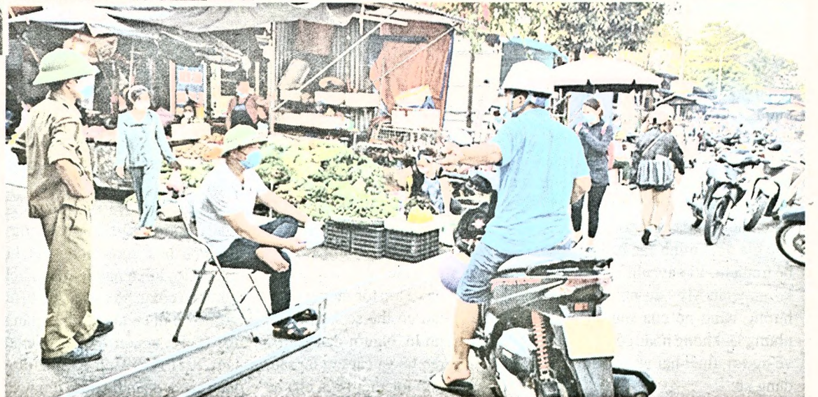
Nhiều người bị từ chối cho vào chợ vì không có thẻ hoặc không mang theo thẻ.