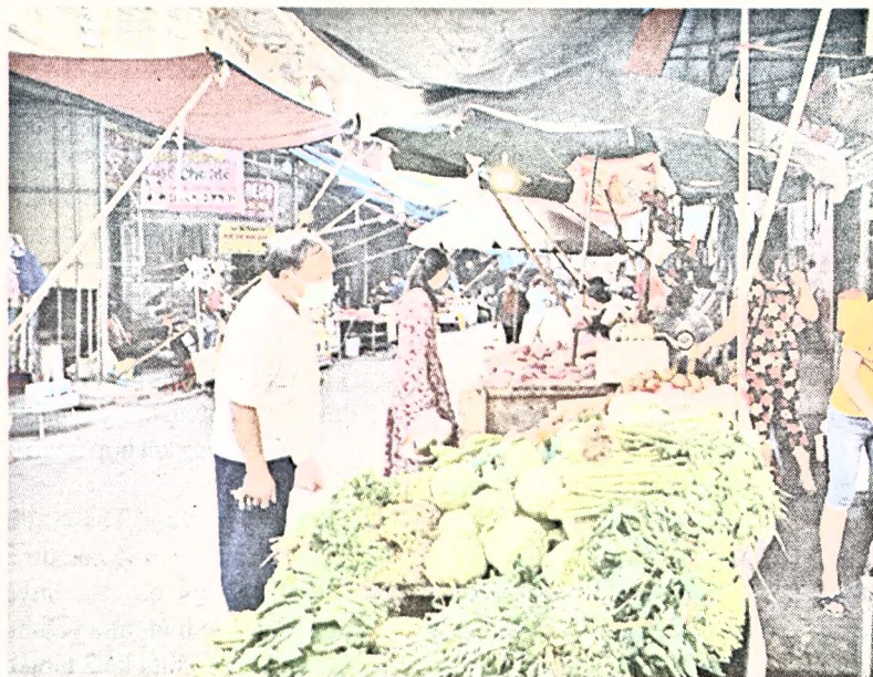
Người dân được tuyên truyền tổ chức cơ cấu bữa ăn hợp lý, nắm rõ và nghiêm túc thực hiện phương án phân chia tần suất đi chợ.