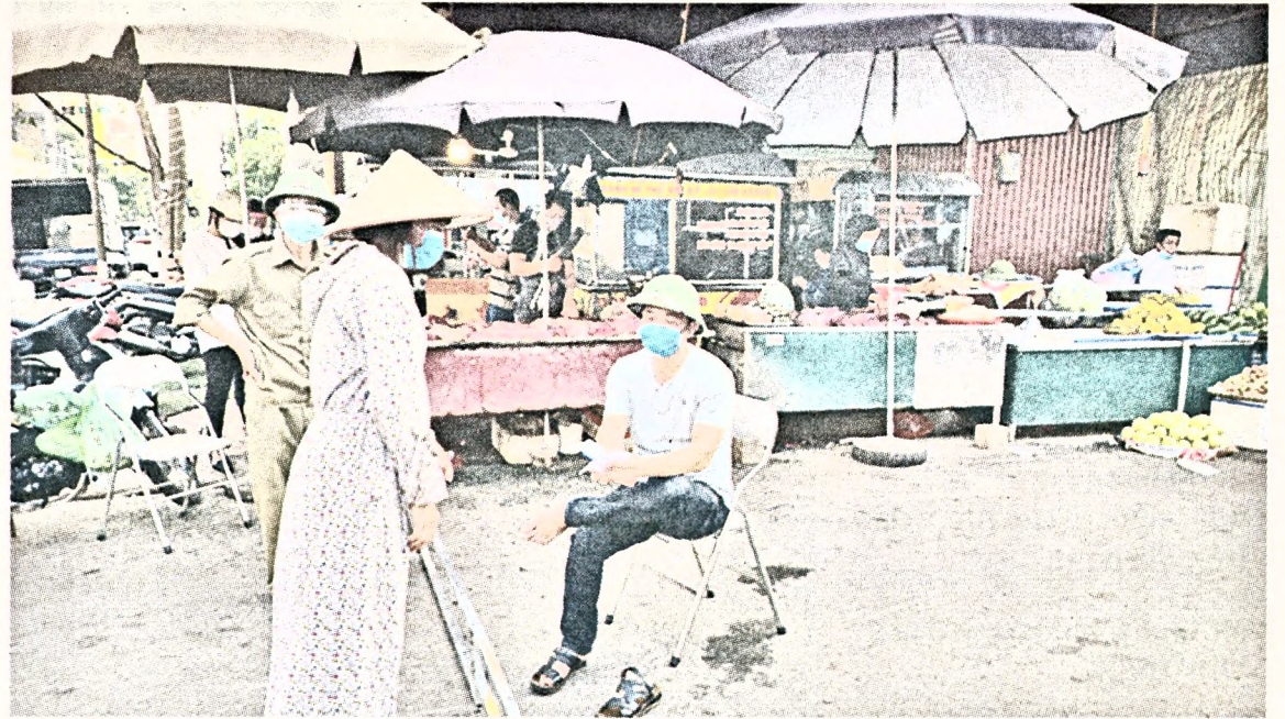
Người dân xuất trình thẻ khi vào chợ. Thẻ có giá trị sử dụng 1 lần/lượt bất kỳ.