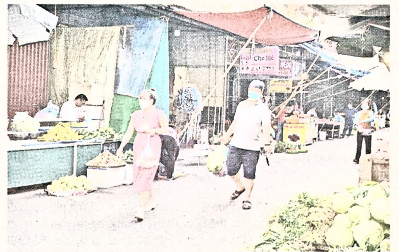
Người mua hàng giữ khoảng cách, đeo khẩu trang trong suốt thời gian vào chợ.