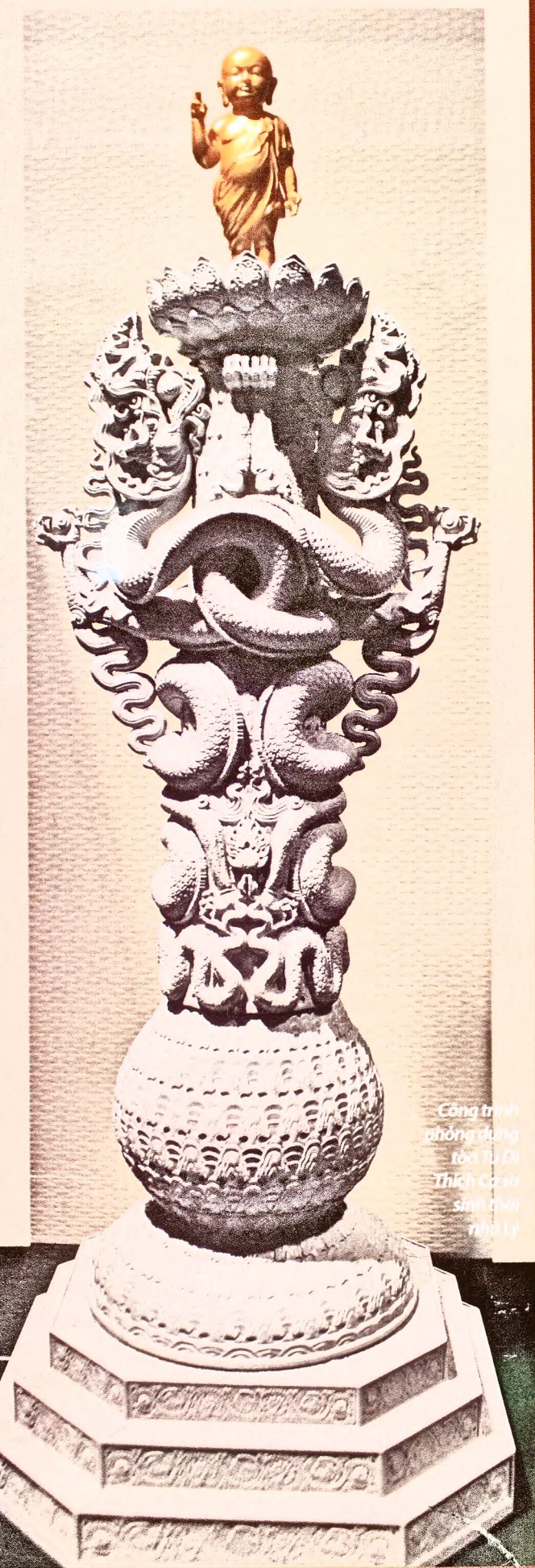
Công trình phông dựng tòa Tu Di Thích Ca sơ sinh thời nhà Lý