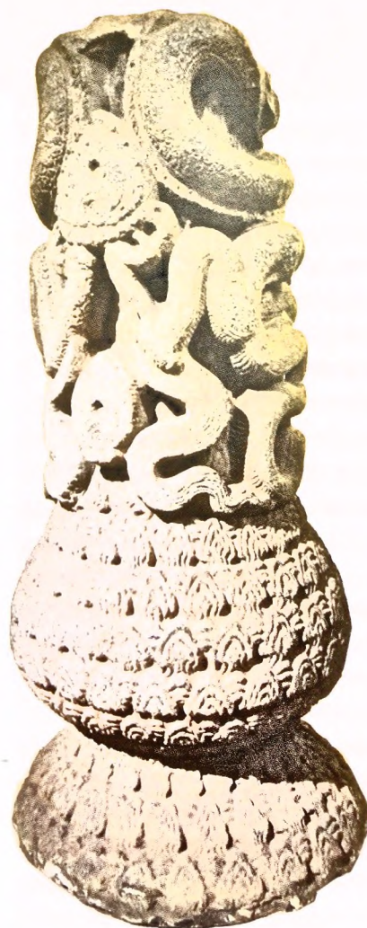
Hiện vật trụ đá Bách Thảo hiện trưng bày tại Bảo tàng Lịch sử quốc gia Việt Nam

Theo cố Giáo sư Hà Văn Tấn, “Từ Lê trung hưng cho đến Nguyễn, tức từ thế kỷ XVII đến nửa đầu thế kỷ XX, các dấu tích văn vật của tòa Cửu long đã trở nên phong phú hơn bao giờ hết, đã trở thành một