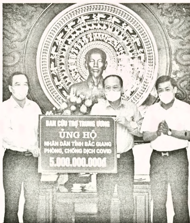
Phó Chủ tịch Ngô Sách Thực trao hỗ trợ cho tỉnh Bắc Giang