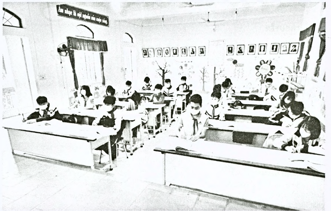
Một lớp học của Trường THCS Thanh An (Thanh Hà, Hải Dương).