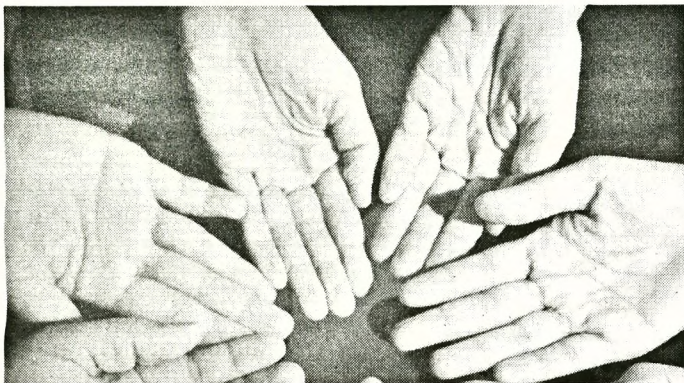
◉ Những đôi tay nhăn nheo, trắng bợt vì ngâm trong mồ hôi của chính mình của những nhân viên y tế. P.V

chỉ đề nghị đoàn Hải Dương chi viện 3 ngày, nhưng diễn biến dịch quá phức tạp, giờ đã kéo dài nửa tháng. Tuy nhiên, anh chị em trong đoàn đều xác định hết dịch mới về. “Có hôm về đến nơi đóng quân, đồng hồ đã điểm gần 1 giờ sáng. Do mệt mỏi quá nên nhiều người cũng không thiết ăn, chỉ uống nước cho đã khát rồi đi ngủ. Tranh thủ chợp mắt 2-3 tiếng rồi lại dậy tiếp tục một ngày mới. Vất vả là vậy nhưng mọi người đều tự bảo nhau cố gắng để sớm cùng Bắc Giang khống chế dịch, giữ yên bình cho Hải Dương và các tỉnh khác” - chị Hằng cho hay.