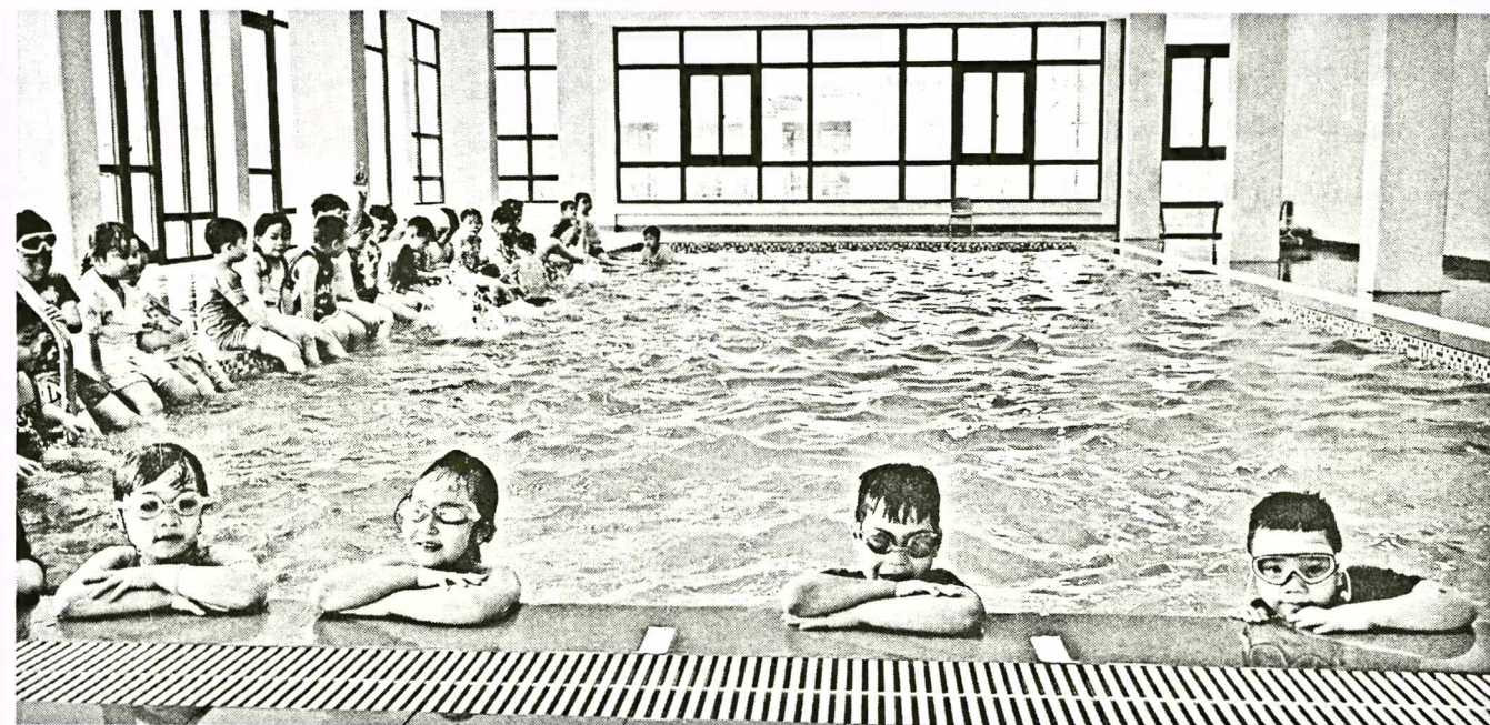
Học sinh Trường Tiểu học Đình Bảng 1 tại lớp bơi.

Một trong nhiều hoạt động mà Tinh đoàn Bắc Ninh triển khai thu hút sự quan tâm lớn của phụ huynh, học