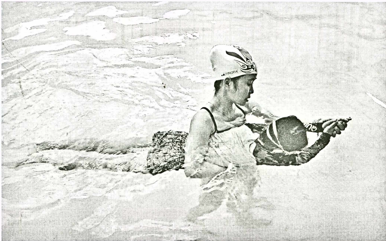
Một lớp dạy bơi cho trẻ em.