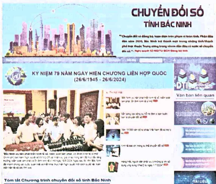
● Trang thông tin về chuyển đổi số tỉnh Bắc Ninh.