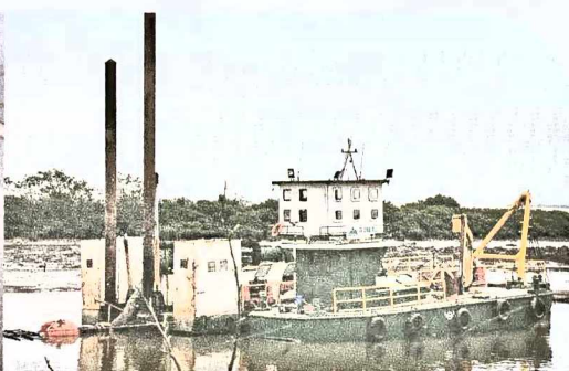
Tàu hút phun trên bãi đổ thải của Chấn Nam

Những ngày này, luồng hàng hải Hải Phòng đoạn kênh Hà Nam vẫn nhộn nhịp tàu bè qua lại. Trên đoạn luồng ấy, những công nhân, thuyền viên trên các xáng cạp, tàu hút bùn, sà lan của Công ty TNHH Xây dựng Chấn Nam (Chanaco) đang miệt mài cho những giai đoạn cuối cùng của Dự án nâng cấp luồng hàng hải đoạn từ vũng quay tàu cảng container quốc tế Hải Phòng đến cảng Nam Đình Vũ (đoạn kênh Hà Nam). Trước đó, nhà thầu đã huy động và tăng cường nhiều phương tiện, thiết bị để đưa dự án về đích đúng tiến độ.