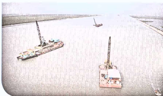
Phương tiện của Chấn Nam thi công trên đoạn luồng kênh Hà Nam

Hơn 20 năm hoạt động và phát triển, Công ty TNHH Xây dựng Chấn Nam trở thành địa chỉ uy tín, tin cậy của nhiều chủ đầu tư cho các dự án nạo vét sông biển, luồng lạch.