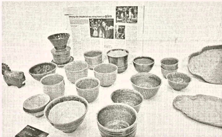
Các sản phẩm gốm trưng bày tại triển lãm.

Sự đa dạng hóa sản phẩm gốm, với kích cỡ nhỏ, cộ công năng và thẩm mỹ cao hơn là một hướng đi phù hợp với thị hiếu và nhu cầu của thị trường. Nhất là quá trình sản xuất vẫn giữ được tính thủ công, màu men thành phần tự nhiên càng làm tăng giá trị của từng sản phẩm. Kết hợp với kỹ thuật làm gốm của Nhật Bản, đáp ứng yêu cầu tiêu chuẩn của họ (an toàn, tự nhiên), gốm Phù Lãng có thể khẳng định hơn nữa giá trị của mình. Điều này gợi nhắc chúng ta về các sản phẩm gốm đặc trưng thời Lý, Trần, Lê, trong đó có dòng gốm Chu Đậu (Hải Dương) của Việt Nam niên đại thế kỷ 13 - 16 ở giai đoạn rực rỡ từng được xuất khẩu ra thế giới.