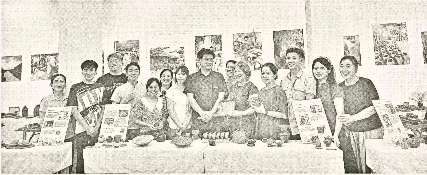
Học viên, nghệ nhân và khách tham quan chụp ảnh lưu niệm.

Nằm trong khuôn khổ chương trình hỗ trợ phát triển của JICA (Cơ quan Hợp tác Quốc tế Nhật Bản) và làng Toho thuộc tỉnh Fukuoka Nhật Bản - nơi nổi tiếng với nghề sản xuất đồ gốm, dự án phát triển nghề làm gốm tại xã Phù Lãng, thị xã Quế Võ, tỉnh Bắc Ninh giai đoạn 2021 - 2024 đã ra mắt thành quả minh tại Bảo tàng Phụ nữ Việt Nam bằng triển lãm mang tên “Thủy cung gốm Phù Lãng” từ ngày 26.6 - 2.7.2024.