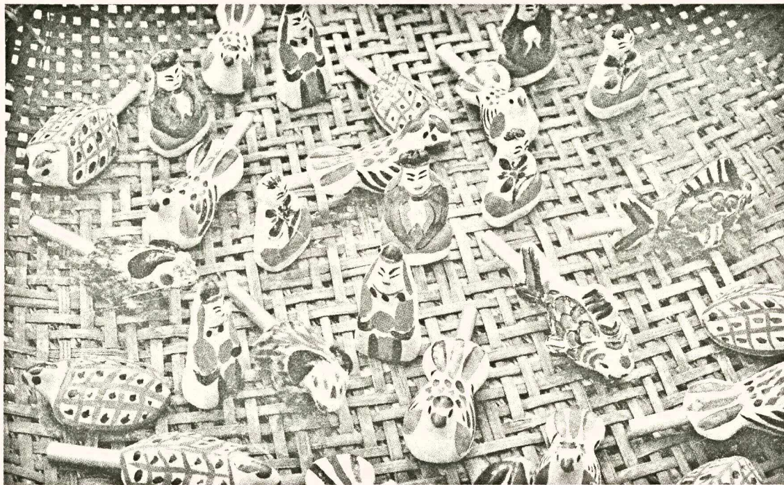
Những con phỗng đất đủ màu sắc được bày trên mẹt tre cũ

Những con phỗng đất luôn là món quà truyền thống cho trẻ em mỗi dịp trung thu đến. Nhưng trong dòng xoáy của sự phát triển, với sự lên ngôi của các loại đồ chơi điện tử, nhiều người làm phỗng đất ở làng Đông Khê (xã Song Hồ, H.Thuận Thành, Bắc Ninh) đã bỏ nghề, chỉ còn duy nhất một người vẫn đầu đầu, “thổi hồn” cho phỗng đất.