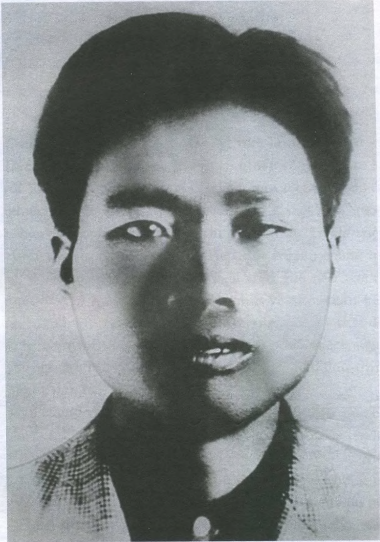
Đồng chí Nguyễn Văn Cừ (1912 - 1941)