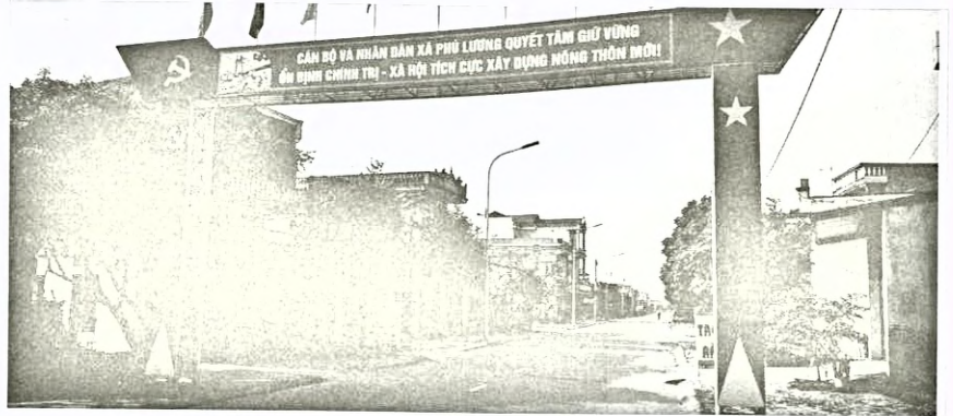
Con đường Nông thôn mới xã Phú Lương.

Theo ông Vũ Văn Tiệp - Chủ tịch UBND xã, hệ thống giao thông, từ năm 2011-2019, toàn xã đã xây dựng trên 40km đường giao thông, trong đó đường từ trung tâm UBND xã đi các thôn được bê tông hóa là 12 km, đường trục thôn, liên thôn, ngõ xóm 28,5 km đảm bảo bê tông hóa đi lại thuận tiện cho nhân dân.