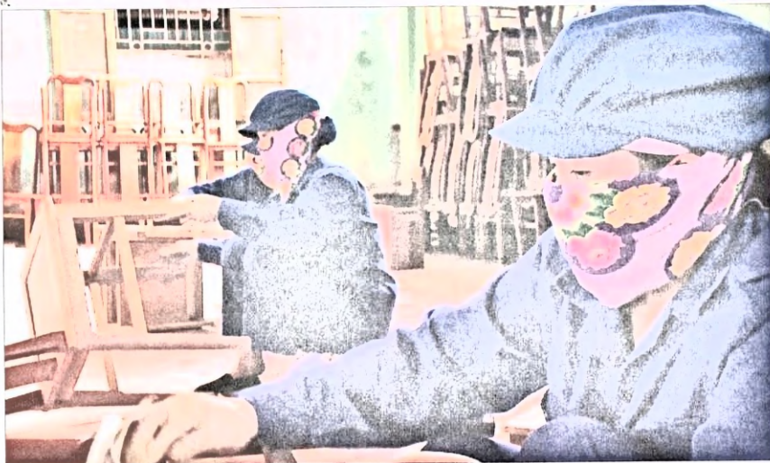
Chương trình khuyến công được đưa vào thực tiễn hiệu quả.

Theo sở Công Thương tỉnh Bắc Ninh, hoạt động hỗ trợ của địa phương đã bám sát chương trình khuyến công ở từng giai đoạn; phù hợp với nhu cầu và khả năng tiếp cận của đơn vị sản