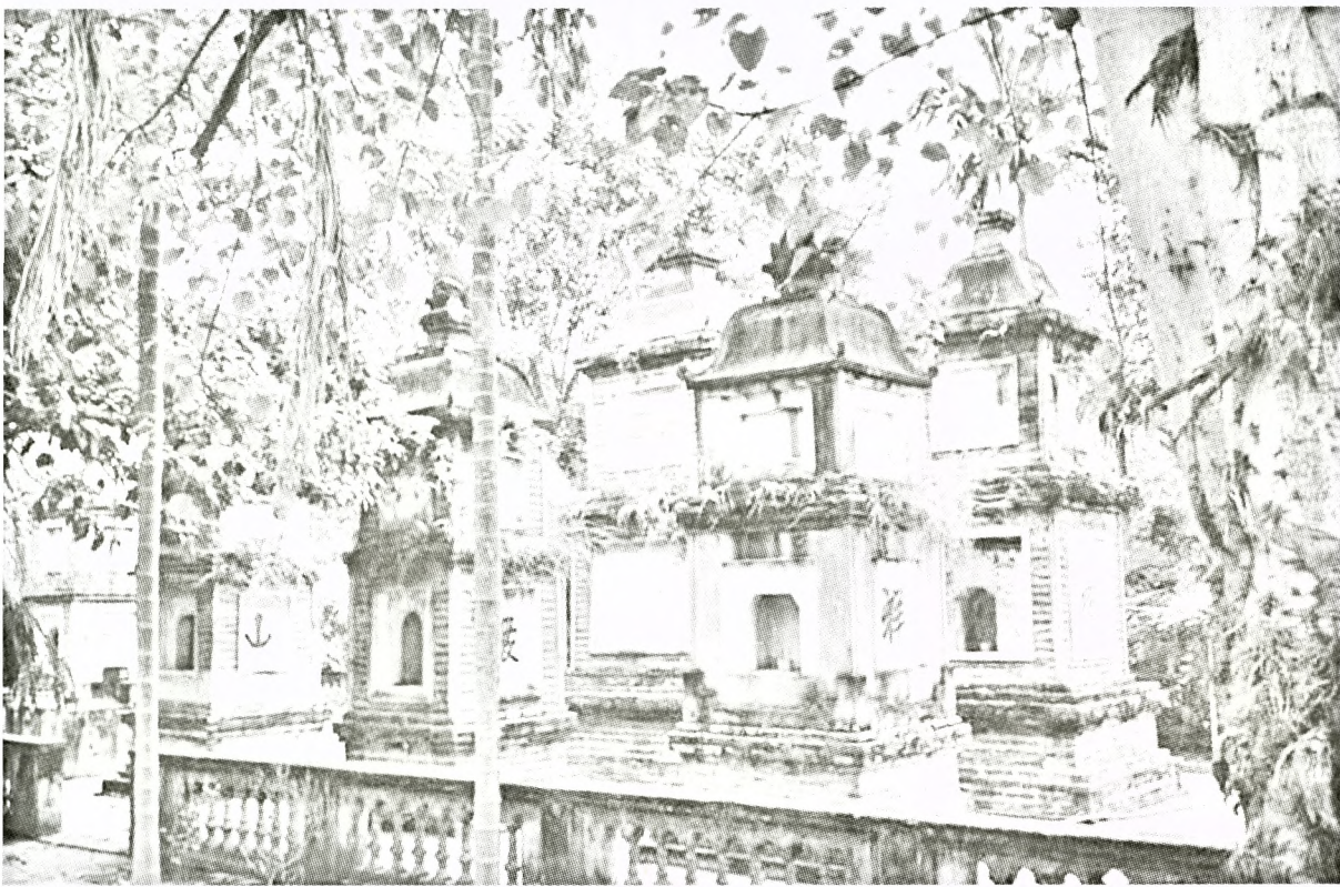
Trong vườn bảo tháp chùa Bút Tháp còn ẩn chứa nhiều bí mật chưa được khám phá.

siêu trong tương quan Thiên – Tịnh – Mật của Phật giáo Lâm tế Đại Việt thế kỷ 17.