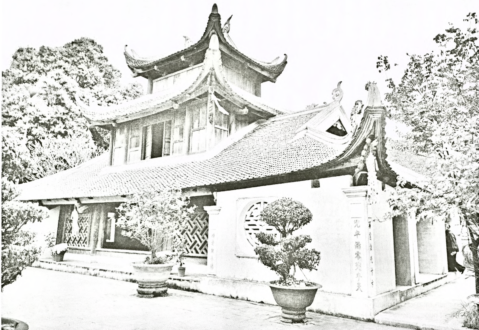
Chùa Bút Tháp không chỉ là cổ tích danh lam mà còn ẩn chứa nhiều bí mật lịch sử.