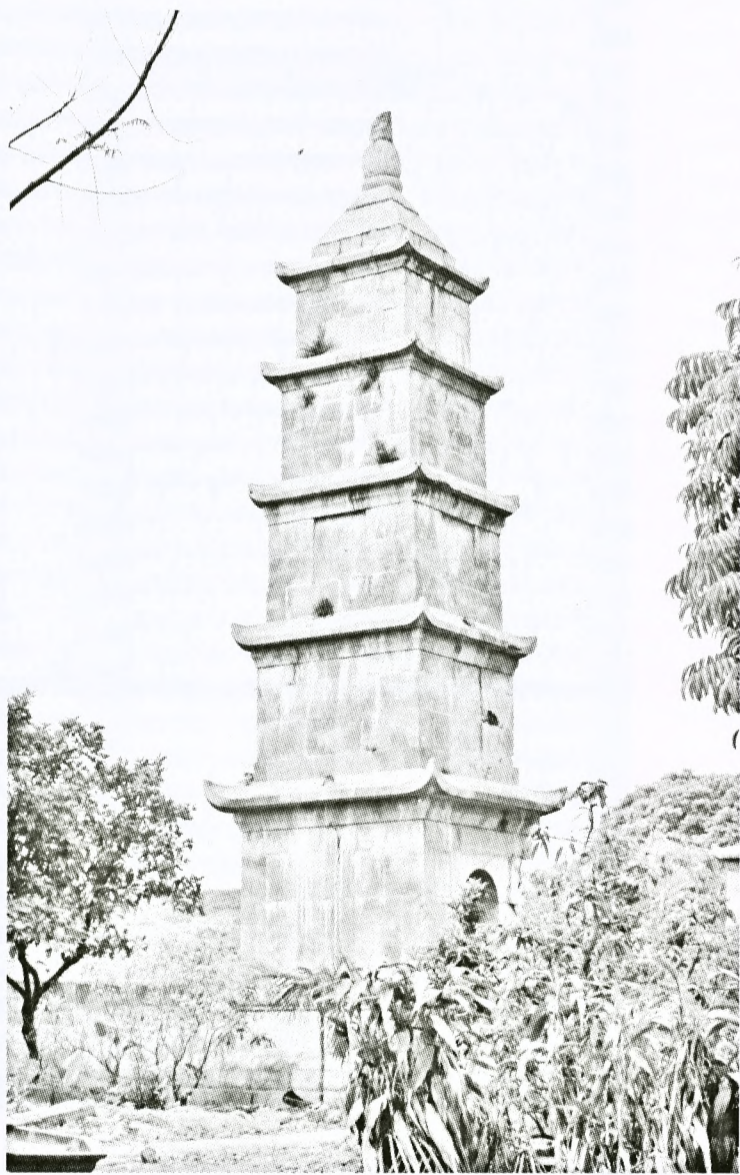
Tháp đá Tôn Đức - nơi phát hiện 2 cuốn sách đồng.

Qua thời gian, phần đỉnh tháp bị cây đại xâm lấn, ăn mòn mạch